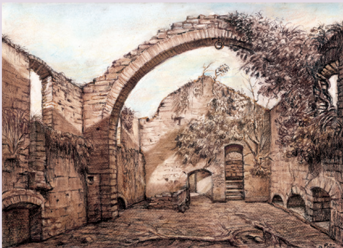
Opera di Dino Petri

I disegni di Dino Petri sulle fonderie e le ferriere e i pannelli descrittivi di Marco Marchetti rendono visibile l’identità del territorio costruita nel passato e invitano alla salvaguardia e alla valorizzazione del Bene, in funzione della trasformazione del modello culturale ed economico delle Colline Metallifere. Il tema è sviluppato anche dal Gruppo Fotografico di Massa Marittima attraverso una serie di dittici che mettono a confronto manufatti del passato e i loro resti, visibili nel presente.