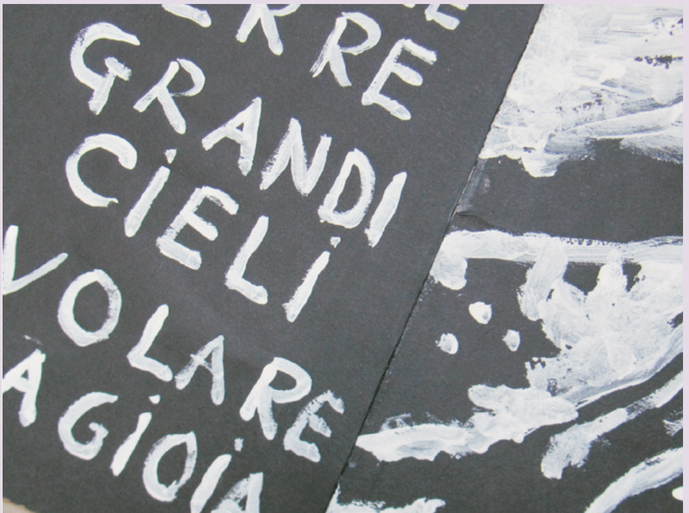
Opera di Gian Paolo Bonesini