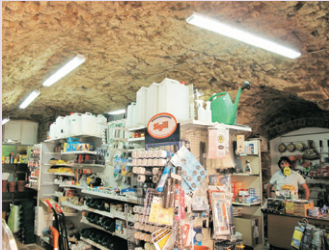
opera del Gruppo Fotografico Massa Marittima